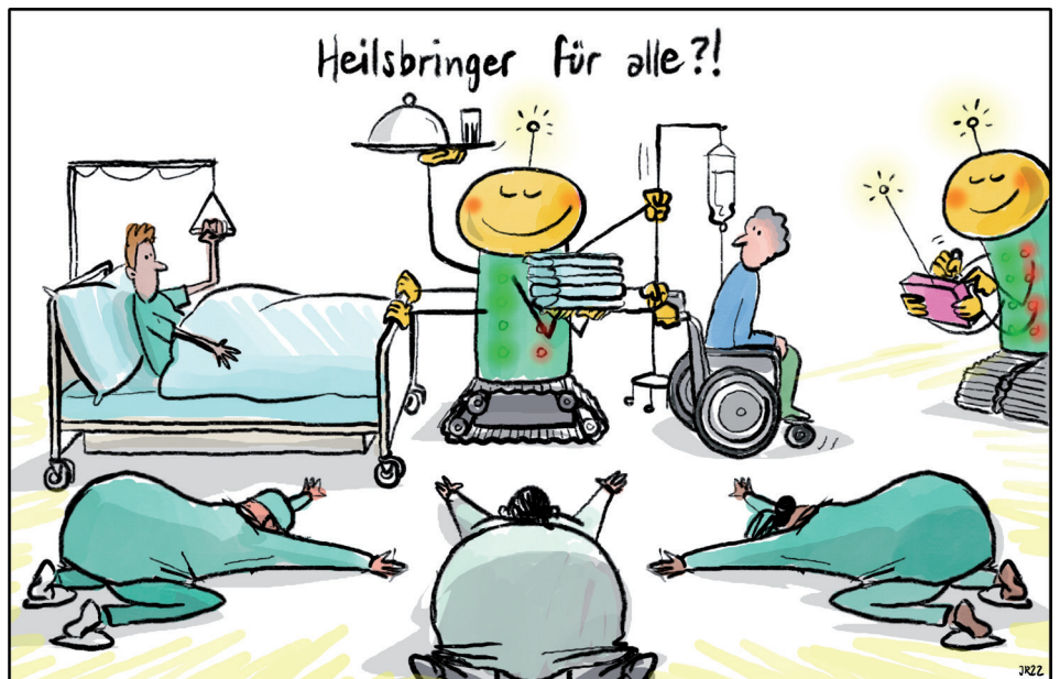
Illustration: Jonas Raeber

Der VZK freut sich, mit namhaften Referentinnen und Referenten aus Medizin, Pflege, Psychoanalyse und Politik das wichtige Zukunftsthema aus verschiedenen Blickrichtungen zu